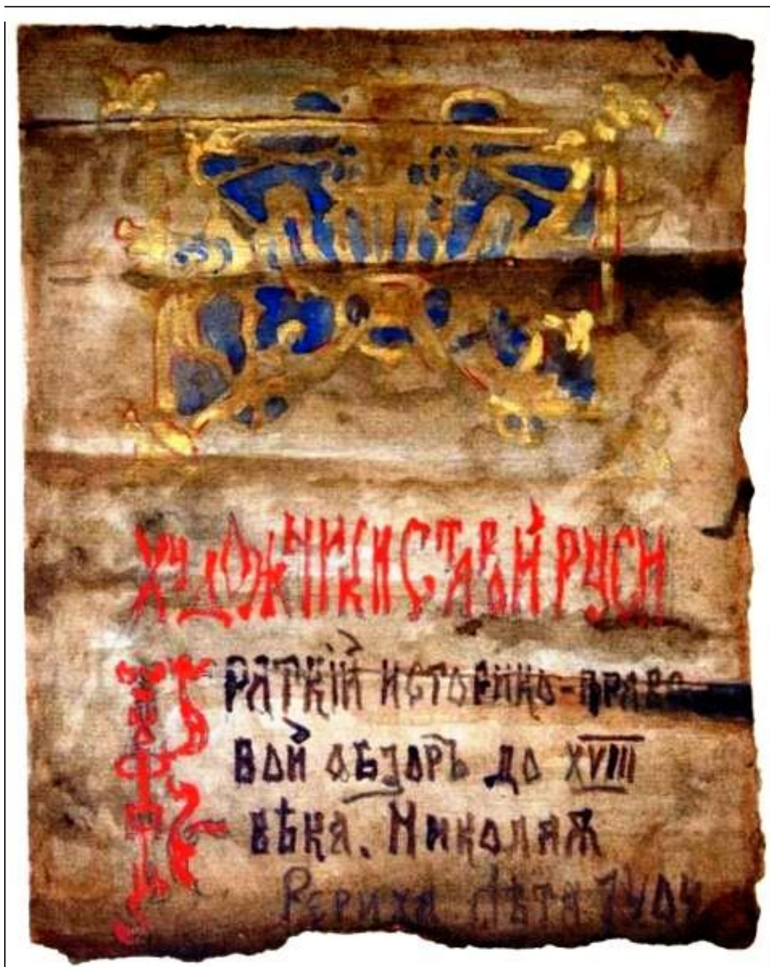
Эскиз обложки зачётной работы «Художники старой Руси. Краткий историко-правовой обзор XVIII века Николая Рериха. Лета 7404». [1896 г.]